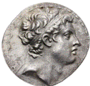
Antiochus IV Epiphanes

Een menselijke veroveraar die, uitgerekend in Jeruzalem, de stad die God verkiest, godslasterlijke uitspraken zal doen en obscene handelingen zal verrichten waarmee hij grote geestelijke en lichamelijke moeite over Gods volk en over de hele wereld zal brengen. Deze profetie is ten dele vervuld door de Seleucische koning van Syrië, Antiochus IV Epiphanes.