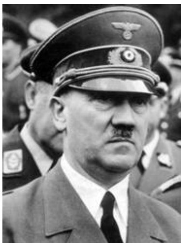
Het beest Adolf Hitler

Tijdens een aanval van demonische razernij, woede en schizofrenie zou Hitler een visioen hebben gehad die bij hem dodelijke angst had veroorzaakt. Hij zou een beeld hebben gezien van de komende antichrist, angstaanjagender en vele malen gewelddadiger dan zijn eigen duivelse regiem. Ze noemden hem ook wel de Teppich fresser . De Bijbel maakt duidelijk dat de komende antichrist volkomen van de duivel bezeten zal zijn en Hitler vele malen in wreedheid zal overtreffen.