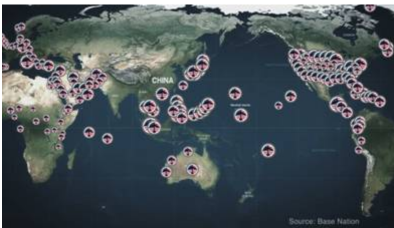
Amerikaanse militaire basis wereldwijd

Wanneer het Witte huis het nodig acht, kan het eenzijdig en zonder enige tegenspraak de nationale regering van een land buitenspel te zetten. In de recente geschiedenis zijn daar diverse voorbeelden van te zien geweest. Begin oktober 2016 waarschuwde generaal Mark Milley, stafchef van het leger voor de 'totale vernietiging' van alle vijanden die de VS in de weg staan. 'Wij zullen iedere vijand vernietigen, waar en wanneer dan ook.' Een mogendheid wordt als vijandig beschouwd zodra ze zich niet onvoorwaardelijk onderwerpt aan de dictaten van Washington. De Verenigde Staten kennen zich het recht toe preventieve aanvallen te lanceren tegen landen met "vijandige bedoelingen". Om dat allemaal kracht bij te zetten beschikt het Amerikaanse leger over ongeveer 800 militaire steunpunten in het buitenland . Dit komt overeen met 95% van alle zich in het buitenland bevindende militaire bases in de wereld .