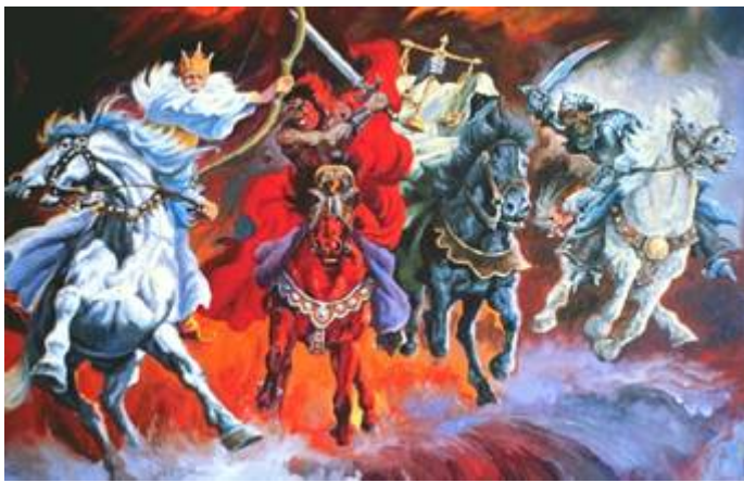
De vier paarden en hun berijders uit het boek Openbaring

Ze komen één voor één op het wereldpodium en hebben alle vier hun eigen werkkerrein. Elk van hen heeft zijn eigen weg te gaan en voert de aan hem gegeven opdracht uit te beginnen met het witte paard en zijn berijder.