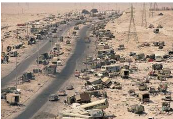
De snelweg naar de dood.

De Tweede Wereldoorlog heeft ongeveer 55 miljoen mensen (soldaten en burgers) het leven gekost. Rusland verloor zo'n 20 miljoen mensen waarvan 13 miljoen militairen. De Vietnamoorlog koste ± 2.5 miljoen doden waaronder 58.200 Amerikaanse militairen. Tijdens de 1 ste Golfoorlog van 1990-1991 verloren 86.000 Iraakse mannen, 48.000 vrouwen en 32.000 kinderen het leven en de gevolgen hiervan vlak na de oorlog. Op de beruchte Snelweg des Doods viel de Amerikaanse luchtmacht op 26 en 27 februari Iraakse troepen en burgers aan die zich uit Koeweit aan het terugtrekken waren. Ze vernietigde eerst de eerste en laatste voertuigen en bombardeerde hierna herhaaldelijk de klemzittende overige voertuigen. Duizenden Iraakse militairen en burgers werden levend verkoold (ongeveer 2000 verkoold voertuigen werden achteraf geteld). Dit gebeurde ondanks het feit dat de VS hadden beloofd dat de terugtrekkende Iraakse troepen en burgers ongemoeid Koeweit zouden kunnen verlaten. Zie ook deze video en deze .