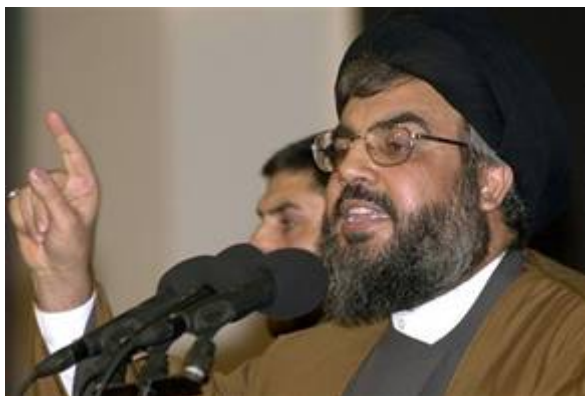
Hezbollah terreurleider Hassan Nasrallah

Zowel de Palestijnse terreurbeweging Hamas (drie nederlagen in 2009-2012 en 2014) als de Libanese terreurbeweging Hezbollah (nederlaag in 2006) bedreigen Israël opnieuw met totale vernietiging. Ook dreigt de leider van Hezbollah Hassan Nasrallah bij een volgende oorlog de grenzen van Libanon te zullen openen voor honderdduizenden toegewijde Shiitische strijders uit onder meer Jemen, Afghanistan, Pakistan, Iran en Irak. In de oorlog van 2006 waren ze praktisch volledig uitgeschakeld maar wisten Washington en de Verenigde Naties een totale vernietiging van Hezbollah te voorkomen. Nu staan ze opnieuw zwaar bewapend aan de noordgrens van Israël wachtend op een signaal van Iran om opnieuw een oorlog te beginnen. Israël heeft zich echter goed voorbereid op een volgende oorlog.