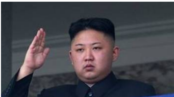
De Noord-Koreaanse dictator Kim Jong un

De Amerikaanse president Donald Trump heeft Noord-Korea in felle bewoordingen gewaarschuwd te stoppen met het bedreigen van zijn land. De president zei dat het regime in Pyongyang kan rekenen op „ vuur en woede zoals de wereld nog nooit heeft mogen aanschouwen ” als het niet inbindt. De spanning loopt steeds verder op vanwege aanhoudende Noord-Koreaanse nucleaire- en rakettesten. Analisten van de Amerikaanse militaire inlichtingendienst DIA concludeerden dat het stalinistische regime een kernkop heeft geproduceerd die klein genoeg is om op intercontinentale ballistische raketten te bevestigen.