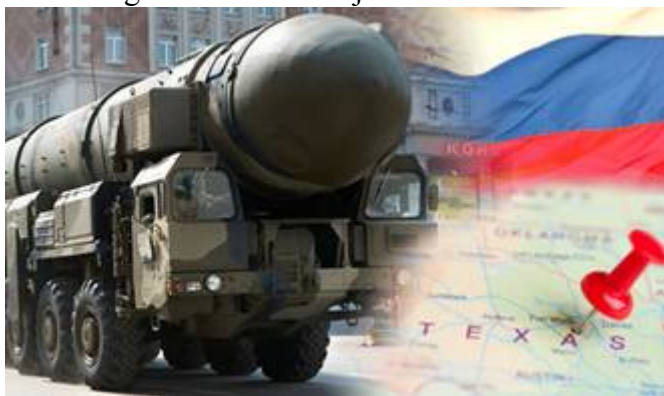
De Sarmat met de bijnaam “Satan 2”

Deze raket zal in 2018 in gebruik worden genomen en zo’n 10 tot 12 kernkoppen met een totale vernietigingskracht van 40 megaton (2000x Hiroshima) met zich mee dragen, en complete landen en landsdelen op 10.000 kilometer afstand van de kaart kunnen vegen. De Russische viceminister van Defensie, Yuri Borisov, verklaarde dat de raket overal ter wereld doelen kan vernietigen. Met de lancering van één zo’n raket kan een gebied ter grote van Frankrijk of Texas totaal worden vernietigd. Ook heeft de test aangetoond het Westerse raketafweersystemen te kunnen omzeilen.