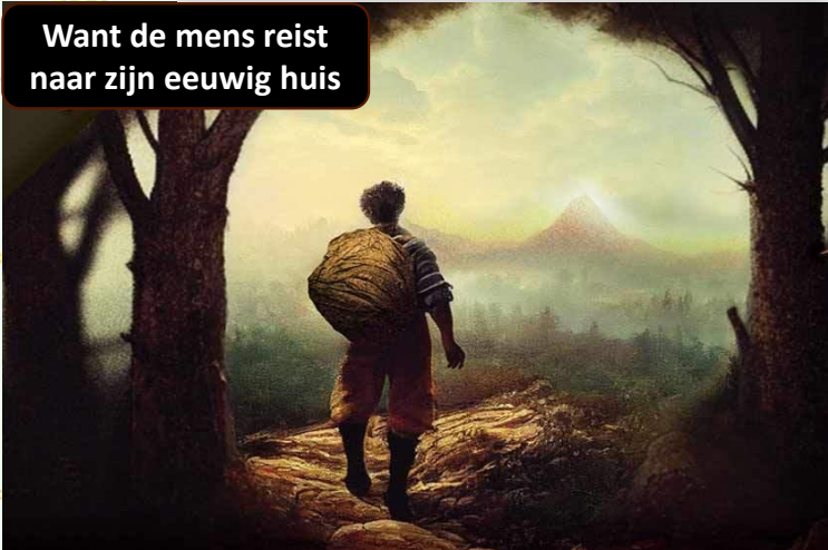
Want de mens reist naar zijn eeuwig huis

De Glind interkerkelijke bijeenkomst Postweg 15a Dinsdag 2 juli 19.30 uur Dhr. L. McClean beziinningsavond over de meest wezenlijke zaken in wijkgebouw De Akker