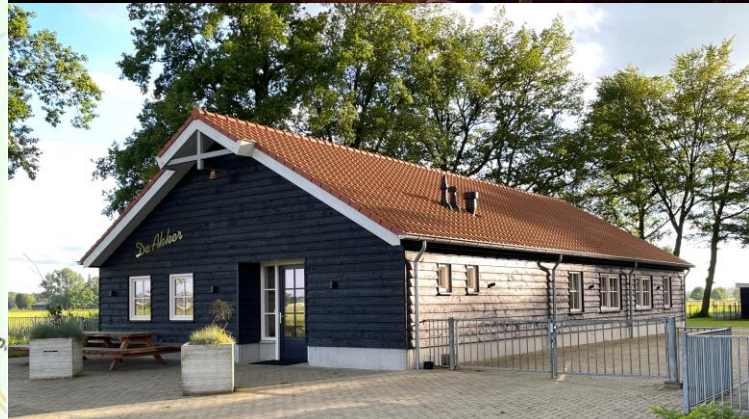
dinsdagavond 02 juli aanvang 19.30 uur