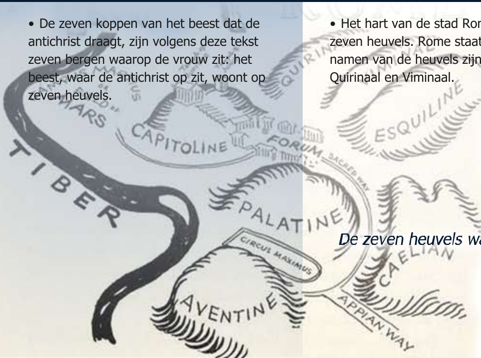
De zeven heuvels waar Rome op is gebouwd

• Het hart van de stad Rome (ten oosten van de rivier de Tiber) ligt op zeven heuvels. Rome staat zelfs bekend als 'de stad op zeven heuvels'. De namen van de heuvels zijn: Palatijn, Capitool, Aventijn, Coelius, Esquilijn, Quirinaal en Viminaal.