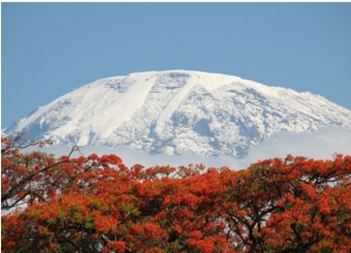
Sneeuw op de Kilimanjaro (2018)

Zo gebruikt hij de filmbeelden van de orkaan Katrina en suggereert dat deze een gevolg is van de opwarming. Gore verspelde ook dat de sneeuw op de Kilimanjaro (de hoogste berg van Afrika) “binnen een decennium” zou smelten. Maar heden ten dage ligt er meer sneeuw op de Kilimanjaro dan ooit tevoren. De grootste sneeuwval is gemeten in 2018.