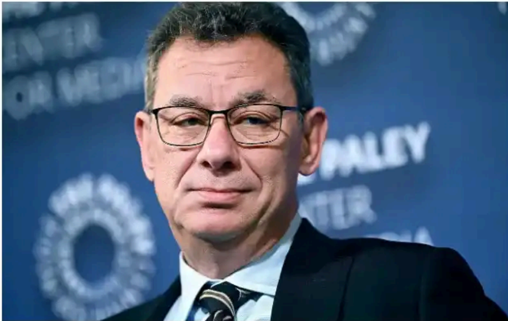
Dr Albert Bourla, the CEO of Pfizer, said Covid in schools was thriving and 'there are kids that will have severe symptoms'

Pfizer's CEO has been rapped by the UK's pharmaceutical watchdog for making "misleading" statements about children's vaccines, The Telegraph can disclose.