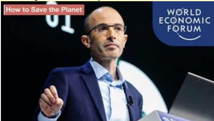
Yuval Noah Harari

Schwab bevestigt dit met de stelling dat een van de resultaten van het maken van elk mens een cyborg zal zijn, dat we allemaal naar één en hetzelfde bewustzijn zullen worden verheven. Een van Schwabs handlangers de sinistere en krankzinnige professor Yuval Noah Harari stelt dat het tijdperk van vrije wil en geloof in God voorbij is, aangezien elk mens nu kan worden gehackt en geprogrammeerd. Tijdens een TED-interview maakte hij geen geheim van zijn overtuiging: "We hebben de grote meerderheid van de bevolking in de vroege 21e eeuw niet nodig, omdat moderne technologieën de menselijke arbeid economisch en militair overbodig maken."