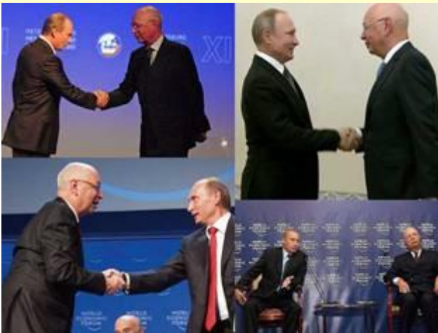
Vladimir Poetin en Klaus Schwab zijn dikke vrienden

Het World Economic Forum Davos heeft aangekondigd alle betrekkingen met Rusland en president Vladimir Poetin te bevriezen. Vanwege de Russische operatie in Oekraïne weigeren ze om te gaan met “gesanctioneerde individuen” en hebben ze alle Rusland-gerelateerde betrekkingen bevroren. WEF-chef Klaus Schwab heeft nog geen commentaar gegeven. De grote vraag is of hij dat nog gaat doen want Poetin en Schwab zijn goede vrienden, Poetin zat óók in Schwabs ‘School of Young Global Leaders’, en Schwab heeft vele connecties in Rusland. Bovendien is Rusland niet antiglobalistisch! De CEO van Sberbank bvb. (een Russische grootbank) zit eveneens in de raad van bestuur van het WEF. Rusland en China, deden net als ieder ander land ter wereld, netjes mee met de covid-lockdowns, PCR-testen, experimentele vaccinatie waarbij duizenden het leven hebben gelaten.