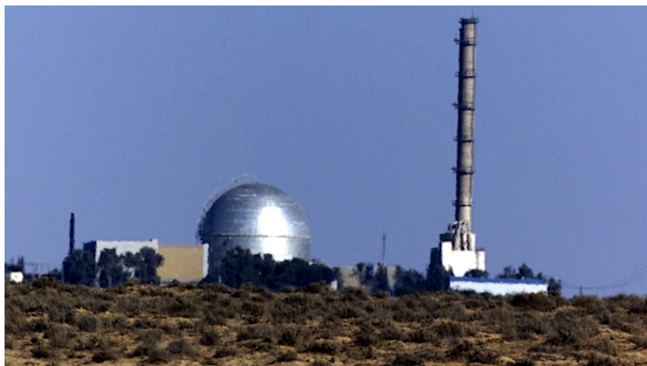
Kernreactor in Dimona

Terwijl zowel de Verenigde Staten als Rusland en Noord-Korea dreigen met de inzet van nucleaire wapens, roept de VN-commissie op tot een kernwapenvrij Midden-Oosten . Met een overweldigende 152-5 meerderheid heeft de VN-commissie Israël opgeroepen afstand te doen van zijn kernwapenarsenaal en al zijn nucleair gerelateerde sites onder toezicht te stellen van het Internationaal Agentschap voor Atoomenergie (IAEA). Er wordt met geen woord gesproken over de dreiging van het Iraanse illegale kernwapenprogramma waarvan bekend is dat het grote hoeveelheden hoogverrijkt nucleair materiaal bezit.