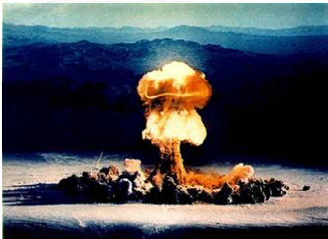
Franse kernproef in de Stille Oceaan.

onbewoonbaar geworden. Landen als Frankrijk, Engeland, Rusland, China en de Verenigde Staten hebben miljoenen mensen tientallen jaren bewust blootgesteld aan radioactieve straling, zij waren volledig op de hoogte van de catastrofale gevolgen van de kernproeven. Toen Jacques Chirac in 1995 president van Frankrijk werd, zei hij nog een serie van acht atoomproeven te willen nemen. Er kwam een golf van protesten uit de hele wereld en van de eilandbewoners waar de proeven genomen zouden worden, maar Chirac zette zijn misdadige plan gewoon door. Met medeweten van de gehele wereld werd het milieu en de gezondheid van de bevolking van de Pacific opgeofferd. De Australische minister Paul Keating reageerde zeer scherp met de woorden: “ De kernproef toont de Franse minachting voor de volken en landen van het Stille Oceaan gebied ”.