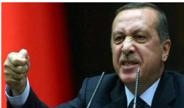
De Turkse dictator 'sultan' Recep Tayyip Erdoğan

Op 30 augustus herdachten de Turken de "Dag van de Overwinning", waarmee ze de overwinning van het Turkse leger op de Griekse strijdkrachten herdenken die in 1922 plaatsvond in de buurt van Afyon Kütahya in Klein-Azië. De Turkse dictator Recep Tayyip Erdoğan maakte van de gelegenheid gebruik een nieuwe tirade tegen Griekenland te beginnen.