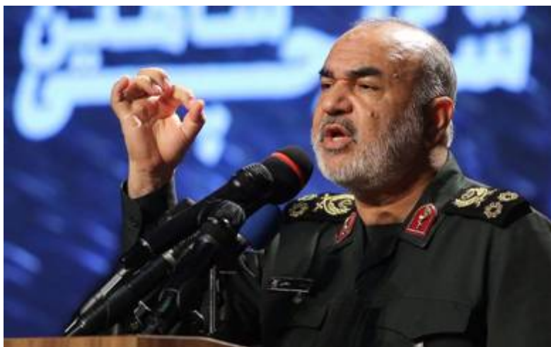
De Iraanse militaire topcommandant van de Islamitische Revolutionaire Garde (IRGC), Hossein Salami

De Iraanse militaire topcommandant van de Islamitische Revolutionaire Garde (IRGC), Hossein Salami gelooft dat Hezbollah en de Palestijnen klaar zijn om Israël daadwerkelijk binnen te vallen en te veroveren. Israël mag dan militair machtig zijn, maar de Iraanse topcommandant zegt dat dit niet betekent dat het niet kan worden verslagen met een goed uitgevoerde invasie. De website van de Iraanse opperste leider ayatollah Ali Khamenei publiceerde een interview met Hossein Salami waarin hij betoogde dat de Palestijnen en Hezbollah een “grondoorlog” moeten beginnen. Hij prees de raketaanvallen op Israël door de Palestijnen en Hezbollah. Maar zo betoogde hij: “raketten zijn uitstekend voor afschrikking of voor het voeren van statische oorlogen maar ze bevrijden het land niet. De Palestijnen hebben een lang gekoesterd doel om Israël te vernietigen en te vervangen door een staat Palestina. Om dit daadwerkelijk te bereiken, moeten zij verder gaan dan geïsoleerde terroristische aanslagen en raketbeschietingen.”