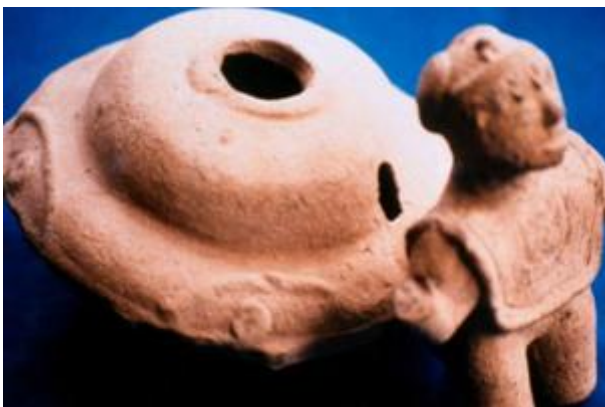
'Flying Saucer' and humanoid figurines from the Acámbaro collection.

Een dergelijke opzet te veronderstellen is echter dwaasheid want dan zouden de Tinajero,s een onvoorstelbaar voorstellingsvermogen moeten hebben gehad en een diepgaande kennis van zoölogie en paleontologie, om maar een paar voorbeelden te noemen. Nee, de beeldjes lijken te zijn gemaakt in een tijd dat de Sauriërs nog op de aarde leefden. Bovendien bleek uit laboratorium onderzoek, na herhaalde proeven dat ze duizenden jaren oud zijn. De beeldjes van Acámbaro werden hierop authentiek verklaard, maar desondanks zijn de "hogepriesters" van de archeologie doorgegaan met ze in diskrediet te brengen. Daarnaast zijn er ook enkele vreemde beeldjes waarvan veel mensen zeggen dat ze op vliegende schotels en zelfs buitenaardse wezens lijken.