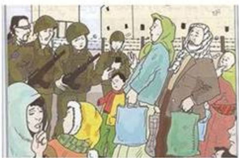
Illustration in Palestinian textbook

In examples, Jews demonized, martyrdom praised, Jewish Quarter removed from Old City map, Hebrew erased from Mandate-era stamp.