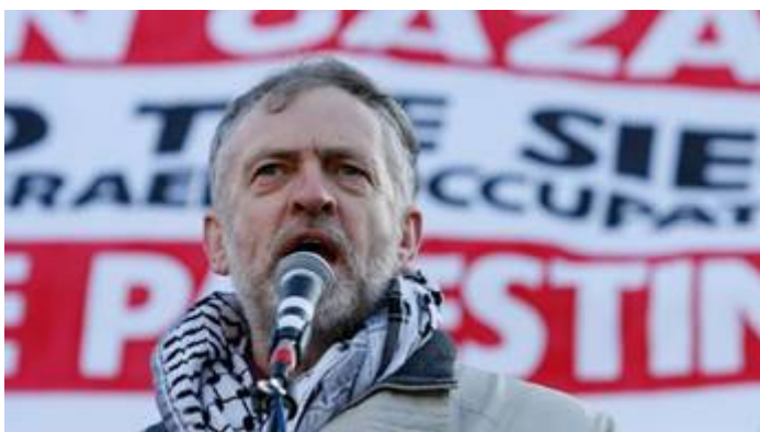
Jeremy Corbyn met Arafat sjaal.

Sinds Corbyns verkiezing op 12 september 2015 als leider van de Labour Party, is er een giftige anti-Israël en anti-Joodse atmosfeer ontstaan die tot gevolg heeft gehad, dat diverse leden van deze partij zijn geradicaliseerd. Zo riepen islamitische Labour-afgevaardigden openlijk op tot de eliminatie van de staat Israël.