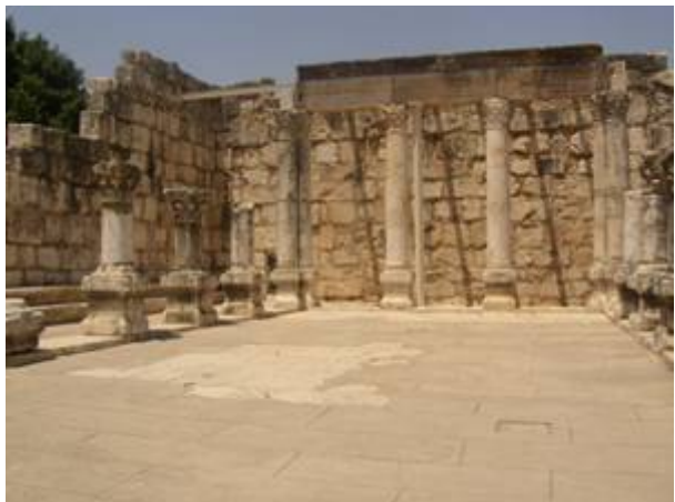
De synagoge in Kapernaüm

bouwen met een heidense tempel op de plaats van de verwoeste Joodse Tempel. Bar Kochba zag zich kans Jeruzalem te veroveren en drie jaar stand te houden tegen de Romeinse overmacht. Maar uiteindelijk brak de Joodse tegenstand toen 50.000 Romeinse soldaten Bar Kochba in de vesting Bethar omsingelden wat een bloedig einde maakte aan de opstand. Bar Kochba sneuvelde met duizenden van zijn volgelingen. Talloze anderen werden gedeporteerd of als slaven verkocht. Ook vanaf die tijd zijn er echter altijd groepen Joden in Galilea en andere delen van het land blijven wonen. Bewijzen daarvoor zijn onder meer te vinden in Kapernaüm, waar de resten te zien zijn van een synagoge uit de vierde eeuw n.Chr. Deze synagoge was gebouwd op de fundamenten van de synagoge uit het begin van de jaartelling. Archeologische ruïnes wijzen op de oprichting van meer dan 80 synagogen, met name in Galilea, gedurende de zes eeuwen na de verwoesting van de tempel.