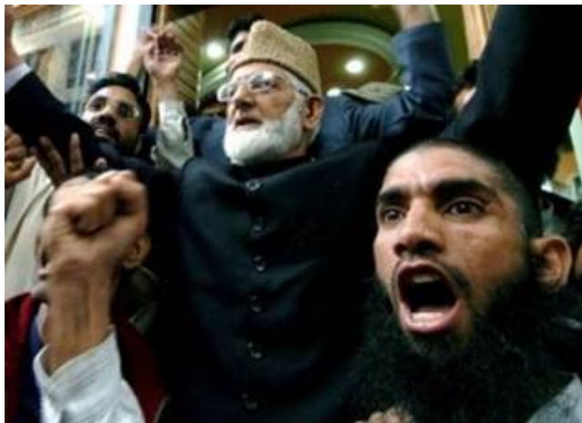
Jihad, Jihad, Jihad....

waarheid ook is. Tekenend voor de politiek correcte houding van ook veel Nederlandse media was de misselijkmakende reactie van een Britse TV verslaggever, die een jong meisje dat het slachtoffer was geworden van groepsverkrachtingen door de moslims 'extreemrechts' noemde, enkel omdat ze met haar verhaal naar buiten was gekomen. Tommy Robinson, die al sinds 2004 waarschuwt voor de hemelgergende toestanden in zijn land: 'Wanneer het gebeurt weet ik niet, maar de grote klap zal komen. Op zeker moment zal het volk in opstand komen. Ze moeten wel. Het is de enige manier om straks nog vrij rond te kunnen blijven lopen...'