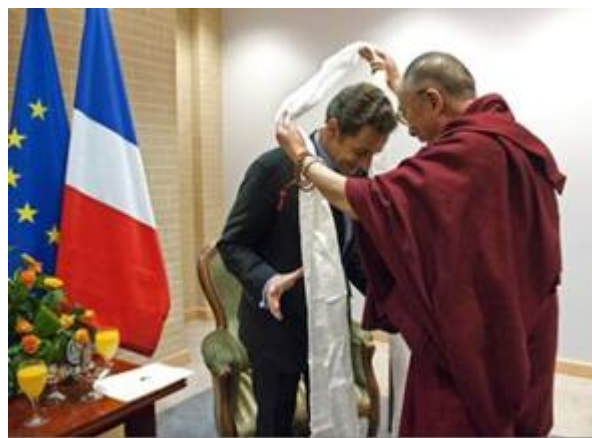
De Lama met de "Prince of

War" Barack Hussein Obama en de voormalige Franse president Nicolas Sarkozy.