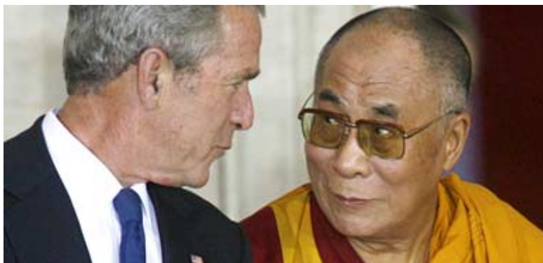
Dalai Lama in 2003 op bezoek bij George W. Bush in het Witte Huis.

„Wanneer de ijzeren vogel vliegt en de paarden op wielen rollen, komt de boeddhistische leer in het land van de rode man”, zo profeteerde de Indiase magiër Padmasambhava in ca 800 n.Chr. Vandaag bezoekt de 14 e Dalai Lama met de “ijzeren vogel” vele westerse landen en maakt discipelen tot in de hoogste kringen toe. De ‘groten der aarde’ verkeren graag in zijn gezelschap en laten zich zelfs door hem adviseren. Zo ontving de voormalige Amerikaanse president George W. Bush hem op 10 september 2003 in het Witte Huis.