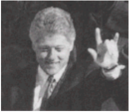
Ook Skull&Bones man, Bill Clinton toont hier het gebaar

Geven George W. Bush en vele andere groten der aarde het signaal om Satan te eren of is het een onschuldige gewoonte? De staat Texas is opgericht door vrijmetselaars en is sindsdien praktisch altijd door vrijmetselaars gerund. Zoals bekend is George W. Bush lid van de "Skull&Bones Orde" de meest occulte tak van de vrijmetselarij, de club die Lucifer als god aanbidden. Op internet zijn diverse afbeeldingen te zien van bekende mensen die ook dit handgebaar maken. Onder hen zijn TV-evangelisten, prins William, ex Beatle Paul McCartney, koning Abdulla van Jordanië, de voormalige aartsterrorist Yasser Arafat, Bill Clinton en diverse rockgroepen zoals de Rockband Metallica.