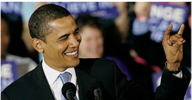
Is Barack Hoessein Obama ook een fan van de Texas Longhoorns?

De Australische popgroep Deicide heeft een CD uitgebracht die aanspoort tot haat en geweld en tot het doden van christenen. Er zijn liedjes op te vinden als "Als Satan straks de wereld regeert". De leider van de popgroep verklaarde in een interview dat hij dagelijks tot satan bidt en God vervloekt. Het komt rechtstreeks uit de diepste satanische duisternis. Satanisten en duivelaanbidders verklaren openlijk dat zij de geestelijke krachten leveren aan dit soort rockmuzikanten. Popzanger en satanist Marilyn Manson roept onder luid gejuich van tienduizenden aanwezigen: "Het is mijn taak het christendom te vernietigen, zodat we niet langer onder de tirannie van dat christelijke fascisme hoeven te leven. Het einde van het christendom is in zicht". En duizenden juichten alsof de grootste overwinning was behaald. De Amerikaanse drugsgoeroe Timothy Leary verklaart brutaalweg: "Ik moet de jeugd klaarmaken voor de antichrist". Ze roepen op om het evangelie van satan uit te dragen, hem te eren en te volgen. De praktijk heeft uitgewezen dat wanneer jongeren een bepaalde tijd aan dit soort muziek worden blootgesteld, er een vorm van razernij, hysterie en woede bij ze ontstaat. Voordat deze muziek op de markt verschijnt, wordt de plaat eerst d.m.v. een soort ritueel, aan de duivel gewijd.