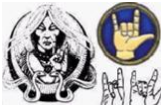
Het is een populair gebaar onder Satan's volgelingen

Geven George W. Bush en vele andere groten der aarde het signaal om Satan te eren of is het een onschuldige gewoonte? De staat Texas is opgericht door vrijmetselaars en is sindsdien praktisch altijd door vrijmetselaars gerund. Zoals bekend is George W. Bush lid van de "Skull&Bones Orde" de meest occulte tak van de vrijmetselarij, de club die Lucifer als god aanbidden. Op internet zijn diverse afbeeldingen te zien van bekende mensen die ook dit handgebaar maken. Onder hen zijn TV-evangelisten, prins William, ex Beatle Paul McCartney, koning Abdulla van Jordanië, de voormalige aartsterrorist Yasser Arafat, Bill Clinton en diverse rockgroepen zoals de Rockband Metallica.