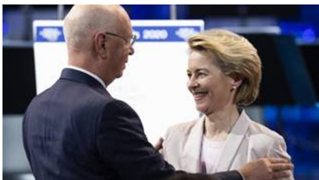
Klaus Schwab met Ursula von der Leyen.

Het Centers for Disease Control and Prevention (CDC) en de Food and Drug Administration FDA in de Verenigde Staten wisten dit, en logen erover. De FDA is een agentschap van de federale overheid in de Verenigde Staten, dat onder andere de kwaliteit en veiligheid van voedsel en aanverwante zaken bewaakt. In het Verenigd Koninkrijk werd over de eerste maanden van 2021 reeds een duidelijke toename van eierstokkanker geconstateerd. De advocaten onderzoeken of zij een zaak kunnen maken van de delicten die zij in de documenten aantreffen, zoals medische wanpraktijk, criminele bedrijfsvoering zoals omschreven in de ‘Racketeer Influenced and Corrupt Organizations (RICO) Act, het schenden van burgerrechten en medisch handelen zonder ‘informed consent’. Dit laatste is een schending van de Neurenbergcode waarvan WEF-sekte Ursula von der Leyen, de grote baas van EuroBabel vindt dat deze code bij het oud vuil gezet moet worden.