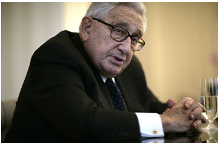
Henry Kissinger, altijd aanwezig