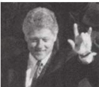
Bilderberg Bill Clinton

David Rockefeller is op 20 maart 2017 in New York op 101-jarige leeftijd overleden. Hij was erfgenaam van het vermogen van een van 's werelds beroemdste en rijkste families. David Rockefeller was de jongste en laatst levende kleinzoon van John D. Rockefeller (1839-1937), de eerste miljardair van de Verenigde Staten. John D. Rockefeller was de oprichter van Standard Oil. Zijn zoon John D. Rockefeller Junior (1874-1960) had zes kinderen, van wie David de jongste was. Hij was de enige zoon die zijn hele leven werkte in de bedrijfswereld. Zo leidde hij de JP Morgan Chase Bank. Rockefeller was een vertrouweling van verschillende wereldleiders. Zo had hij nauwe banden met de Chinese staatsman Deng Xiaoping en Nelson Mandela. Sinds president Eisenhower was Rockefeller een adviseur van elke president van de Verenigde Staten.