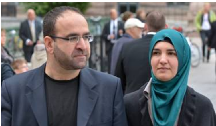
Anti-Israël activist Mehmet Kaplan

In de Zweedse regering zat van 3 oktober 2014 tot 18 april 2016 Mehmet Kaplan, een in Turkije geboren minister voor de Zweedse Groenen. Deze figuur is een pro-Hamas extremist wat mag blijken uit het feit dat hij op 31 mei 2010 meevoer op de flotilla van de Free Gaza Movement in een poging de Israëlische 'blokkade' van Gaza te doorbreken.