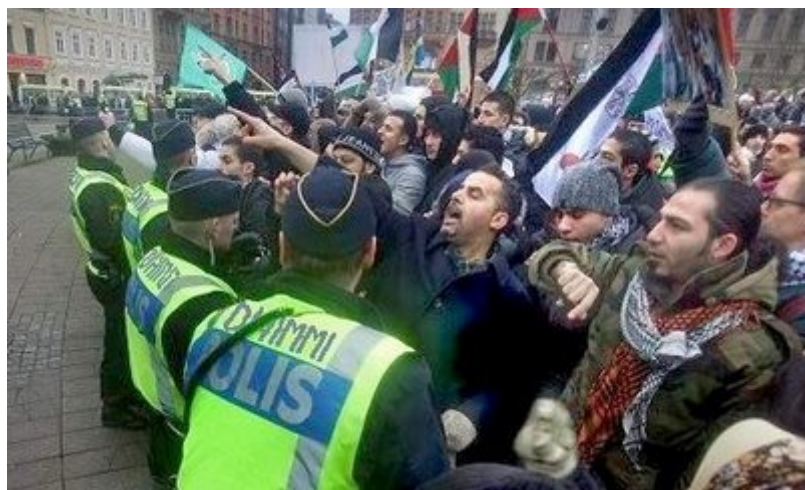
Pro-PLO betogers in Zweden

Malmö wordt effectief overheerst door gewelddadige moslimbendes die nergens meer voor terugdeinzen. Een feestje, georganiseerd voor Joodse kinderen in Malmö, werd aangevallen door misdadigers die de deelnemende kinderen als "Joodse varkens" bestempelden. Antisemitisme is terug en niet alleen in Malmö maar ook in andere delen van Zweden. Een deel van de moslims heeft de Jodenhaat meegenomen uit het land van herkomst. Daarnaast zijn politici, kranten en zelfs kerken verantwoordelijk voor de toename van het antisemitisme vanwege de regelmatige hetze tegen de Joodse staat. Veel Zweedse moslims denken daarom dat antisemitisme acceptabel is en zien dit tevens als een vrijbrief voor gewelddadige activiteiten tegen Joden. In dit land wordt een website waarop een cartoon van Mohammed wordt getoond onmiddellijk door de overheid van het internet gehaald terwijl een islamitische website waarop wordt opgeroepen Joden te vermoorden van diezelfde overheid ongehinderd mag doorgaan.