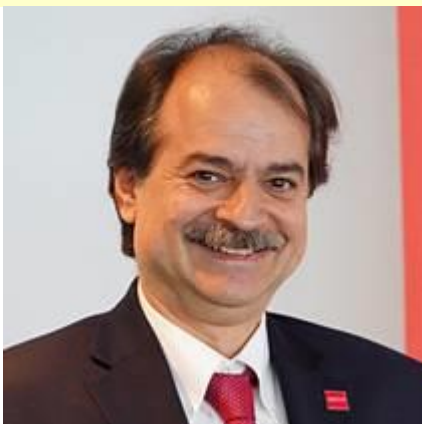
Prof. John Ioannidis

De wereldberoemde professor John Ioannidis van de Stanford-universiteit concludeert dat het sterftecijfer bij corona niet meer dan ongeveer 0,2 procent is. Vergelijkbaar met griep.