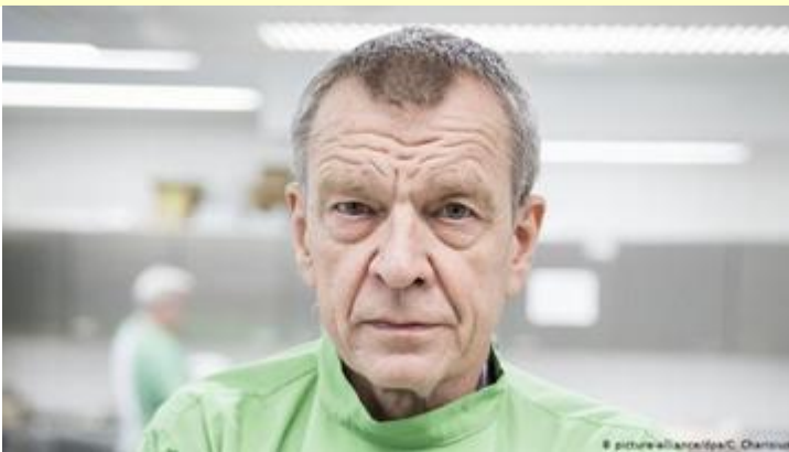
De Duitse Prof: Klaus Püschel

Prof. Klaus Püschel, een gerespecteerde patholoog en hoofd van het Instituut voor Forensische Geneeskunde in het Universitair Ziekenhuis van Hamburg, stelde dat "COVID-19 uiteindelijk niet meer dan een virale ziekte is zoals griep, die in de meeste gevallen onschadelijk is en alleen dodelijk is bij onderliggende ziektes. "Het is belangrijk om naar de nasleep van de epidemie te kijken om te zien of COVID-19 echt de doodsoorzaak was" , merkt Püschel op. "Van de ongeveer 180 overledenen met het coronavirus die we hebben onderzocht, leden allemaal in ernstige mate aan reeds bestaande aandoeningen en waren in ieder geval gestorven."