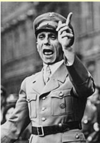
Paul Joseph Goebbels