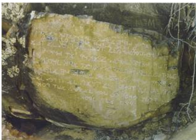
De Los Lunas Tien Geboden steen

(Mysterie Berg). De indianen noemen het "Cerro Los Moqujino" (Rotswand van het vreemde schrift). ("Cliff of the Strange Writings"). Aan de voet van een plateau, bevindt zich een grote vlakke steen van tussen de 80 en 100 ton met daarop een inscriptie geschreven in oud Hebreeuws .