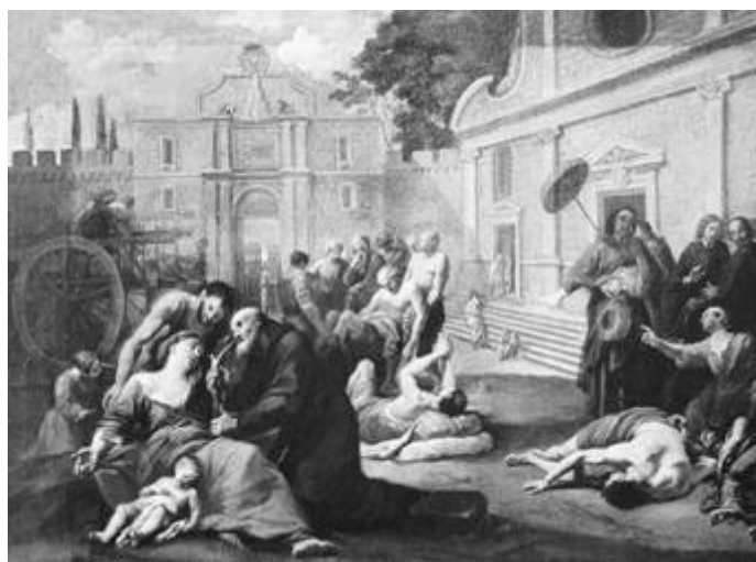
Zwarte dood (pest) in Europa

Zoals gezegd wordt Israël verantwoordelijk gesteld voor zo ongeveer alle ellende in de wereld. En dat is niet alleen iets van de laatste jaren. Zo wordt het joodse volk ook verantwoordelijk gesteld voor de Zwarte Dood de naam voor een epidemische ziekte die tussen 1346 en 1351 in Europa woedde en vele slachtoffers maakte, soms tientallen procenten van de bevolking.