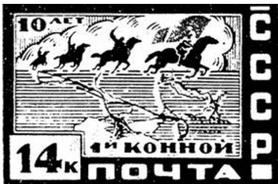
Russische postzegel van 14 Kopek.

Deze aanval werd door de Russen al in 1930 op een postzegel van 14 Kopek afgebeeld. Op de achtergrond is de voormalige Sovjet-Unie te zien en op de voorgrond een aantal paarden die op een pad galopperen dat rechtstreeks naar Israël voert.