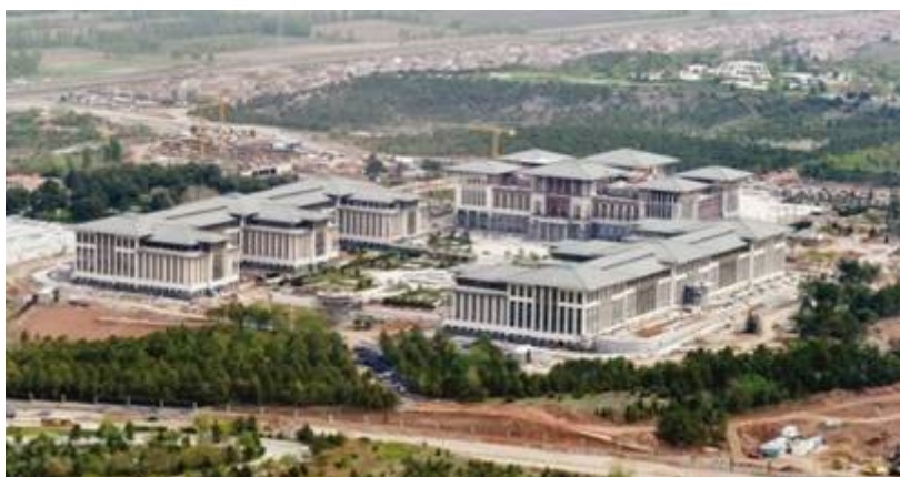
'Sultan' Erdogans speeltje met 1150 kamers.

Turkije wordt geleid door de moslimextremist en dictator Recep Tayyip Erdoğan . Erdoğan heeft de ambitie de absolute macht te verkrijgen over het hele Midden-Oosten wat neerkomt op het herstel van het vroegere Ottomaanse rijk met hem als de nieuwe sultan. Hij heeft voor dat doel een paleis laten bouwen met een oppervlak van 300.000 vierkante meter en 1150 kamers . Maar dat is nog niet alles want de 'sultan' laat daarnaast ook nog een privéresidentie voor zichzelf bouwen met liefst 250 kamers.