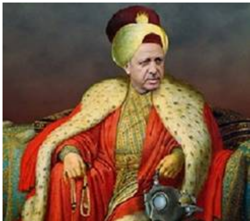
'Sultan' Recep Tayyip Erdoğan

Israëliërs 'de zee in te drijven'. Echt als een verrassing komt het niet, want de vooringenomen media en politici verspreiden deze manipulatieve retoriek. Ook in Turkije worden kinderen al vanaf jonge leeftijd met haat grootgebracht. Inmiddels is er wel weer sprake van emige toenadering tussen Turkije en Israël, maar dat is oppassen voor de Joodse staat want Erdoğan is niet te vertrouwen..