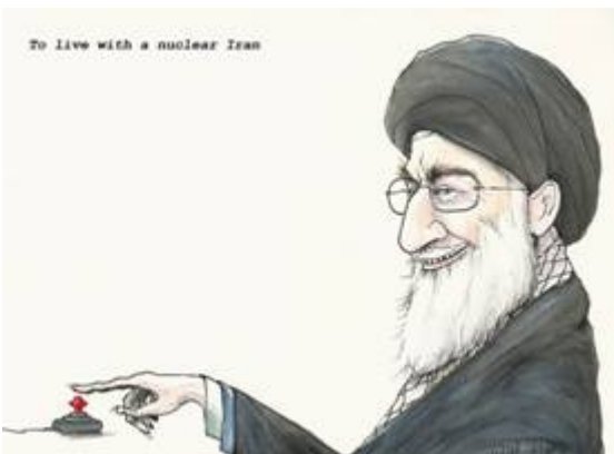
Ayatollah Ali Khamenei met zijn vinger aan de knop

De Iraanse Opperste Leider ayatollah Ali Khamenei legde op 30 januari 2012 een nieuwe doctrine uit waarom het “juridisch en moreel” gerechtvaardigd is om genocide te plegen en Israël van de kaart te vegen. “Israël is een kwaadaardige tumor in het Midden-Oosten”, schreef Khamenei voor de ultraconservatieve Perzischtalige Alef nieuwssite. Hij riep op tot de absolute vernietiging van Israël.