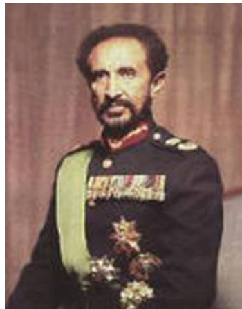
Links de koningin met haar zoon Menelik, rechts keizer Haile Selassie, bijgenaamd 'de