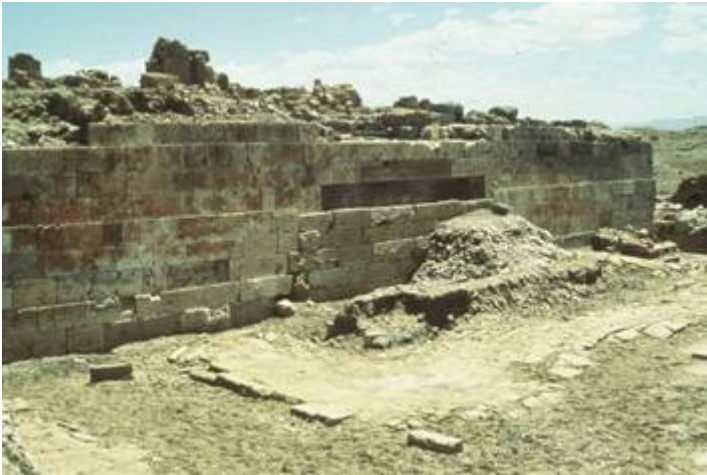
Restanten stuwdam van Marib

van de Inca's uit het hoogland van Peru. Onderzoekers stelden vast dat er in de Sabeïsche tijd bij Marib een vlakte van 300.000 hectare werd geïrrigeerd en dat het aangelegde irrigatiesysteem 2000 jaar intact is gebleven door zijn geniale eenvoud en de functionele bouw van het complex. Volgens de overlevering zou de oorspronkelijke stuwdam al in 1700 v. Chr zijn gebouwd en later door de Sabeërs van sluizen zijn voorzien.