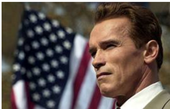
Arnold Schwarzenegger ,voormalig gouverneur van Californië

Volgens een artikel in de San Francisco Chronicle van 23 juli 2003 is op de Grove ook het idee gerezen om Arnold Schwarzenegger in Californië aan de macht te helpen. Belangrijkste promotor van dit plan was George Shultz, voormalig minister van buitenlandse zaken van de VS en topman van het Bechtel concern dat na de inval in Irak vette opdrachten heeft binnengehaald om in Irak aan de slag te gaan. In september 2002 was Schwarzenegger te gast op een geheime bijeenkomst in Waddeson Manor (landgoed van Lord Jacob Rothschild) in Engeland. Dit is destijds door het Britse dagblad The Times onthuld. Maar deze publicatie trok geen enkele aandacht, want niemand wist nog dat men Schwarzenegger naar voren wilde schuiven voor de post van gouverneur van Californië. Op het landgoed van Rothschild is de kandidatuur van Schwarzenegger voorbereid door machtige financiers en politici. Schwarzenegger, bekend als de "Terminator" (vernietiger/verdelger) fungeert thans als marionet van de Illuminatie en loopjongen van de Bush dynastie. Hij geniet alom grote bekendheid en heeft wereldwijd een enorm aantal fans.