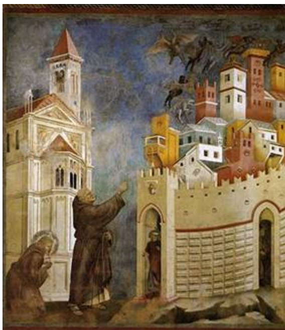
Sint Franciscus die duivels uitdrijft in Arezzo. Schilderij van Giotto

Het exorcismegebed gaat terug op Jezus zelf die het heeft toegepast zoals in Marcus 1:23-28 wordt beschreven; En terstond was er in de synagoge een mens met een onreine geest en hij schreeuwde luid, zeggende: Wat hebt gij met ons te maken, Jezus van Nazareth? Zijt gij gekomen om ons te verdelgen? Ik weet wel, wie Gij zijt: de heilige Gods. En Jezus bestrafte hem (zeggende): Zwijg stil en ga uit van hem. En de onreine geest deed hem stuip trekken en ging onder groot geschreeuw van hem uit. Ook de macht en de taak van de Kerk om exorcisme toe te passen zijn gebaseerd op de woorden van Jezus zelf Marcus 3:15, 6-7-13 en 16-17.