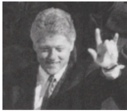
Ook Skull&Bones man, Bill Clinton toont hier het gebaar.

ex Beatle Paul Mc Cartney, koning Abdulla van Jordanië, de voormalige aartsterrorist Yasser Arafat, Bill Clinton en diverse rockgroepen zoals de Rockband Metallic. Voor meer informatie, klik op: http://www.jesus-is-savior.com/False%20Religions/Wicca%20&%20Witchcraft/signs_of_satan.htm