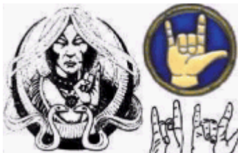
Het is een populair gebaar onder Satan's volgelingen

Het handgebaar staat voor een teken dat bekend staat onder verschillende namen zoals "El Diablo", "Il Cornuto" ook wel "Heil Satan" en verder the horn, horned devil, devil salute. Het Amerikaanse Football team The Texas Longhorns voeren het "Diablo" gebaar als hun mascotte. Ook de duizenden fans van deze club tonen dit gebaar. Maar het gebaar heeft ook een heel andere betekenis en bestond al lang voor de oprichting van de The Texas Longhorns.