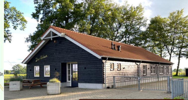
Herv. wijkgebouw De Akker