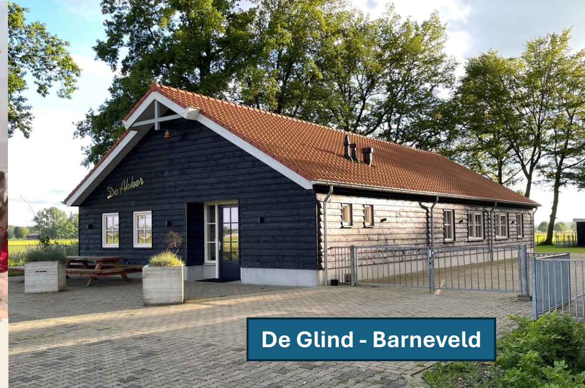
De Glind - Barneveld